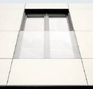
Die Fenster sorgen für optimales Tageslicht.

Alle Interessierten sind eingeladen, die Büroräumlichkeiten am Samstag (24. Juni) zwischen 10 und 16 Uhr zu besichtigen. Treffpunkt ist der Eingangsbereich des Planungsbüros Kemper Am Güterbahnhof 25 in Dorsten.