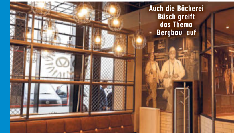
Auch die Bäckerei Büsch greift das Thema Bergbau auf