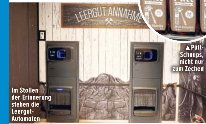
Im Stollen der Erinnerung stehen die Leergut-Automaten