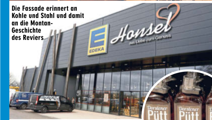
Die Fassade erinnert an Kohle und Stahl und damit an die Montan-Geschichte des Reviers