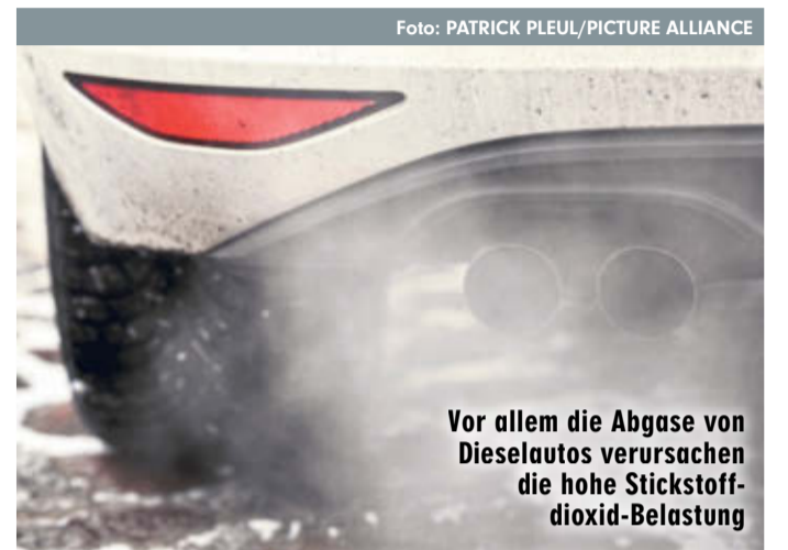
Vor allem die Abgase von Dieselaautos verursachen die hohe Stickstoffdioxid-Belastung

haben u.a. zugesagt: Bernhard Aichner, Simon Beckett, Simone Buchholz, Chris Carter, Arne Dahl, Sebastian Fitzek, Nina George, Petra Hammesfahr und Ingrid Noll. Sie lesen in Schlössern, Kirchen, Museen und Industriedenkmalen, in Saunen und Höhlen, bei Bestattern oder auf Schiffen. Der Vorverkauf startet am kommenden Montag.