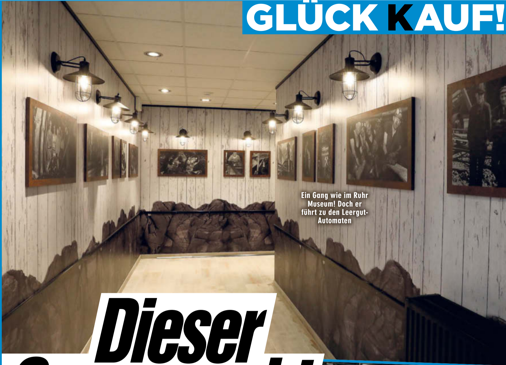
Ein Gang wie im Ruhr Museum! Doch er führt zu den Leergut-Automaten